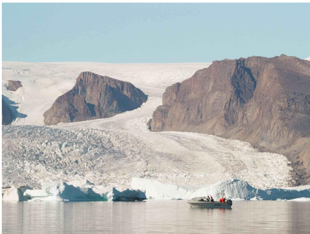
図 2：重要な採餌場所とされるカービング氷河前縁。

一方、北極域ではイヌイットが海棲哺乳類を狩猟し、自給自足の生活を営んでいます。イヌイットの協力を得て、捕獲場所と胃内容物を組み合わせて解析することで、海棲哺乳類が「いつ・どこで・何を・どのくらい食べているのか」まで明らかにすることが可能になります。