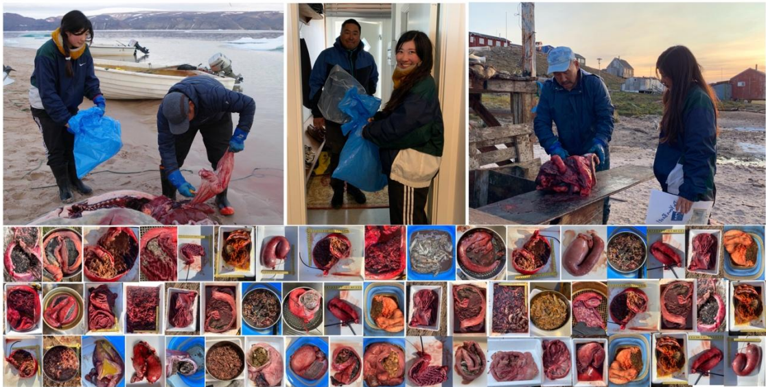
図3：イヌイットと協力して狩猟された個体から胃を収集し、内容を解析した。

その結果、沖合で捕獲された個体は空胃が多かったのに対し、氷河前縁付近で捕獲されたアザラシは、沖合で捕獲された個体よりも多くの餌を摂取していることが明らかになりました。また、氷河前では主にホッキョクダラを、沖合では動物プランクトンを食べているという、場所による採餌対象種の違いも初めて明らかになりました。