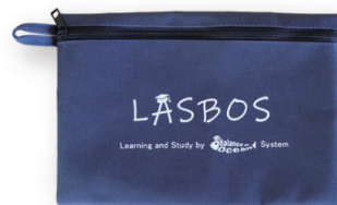
LASBOSオリジナルポーチ (サイズ:180mm×160mm)