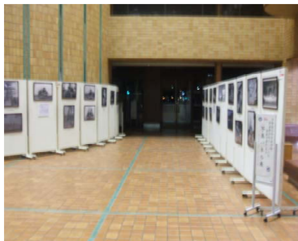
－ 展示風景全景(その2)－