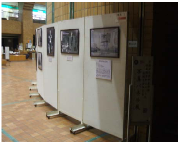
－ 展示案内と初代「忍路丸」－

なお、今回は、年明けの平成22年2月1日(月)から2月11日(木)までの期間でJR函館駅2F「イカすホール」で、最終回は、2月22日(月)から3月12日(金)までの期間で札幌キャンパス「エンレイソウ」で開催する予定です。